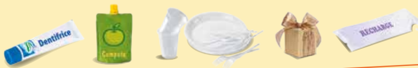
Autres emballages en plastique

UN DOUTE ? UNE QUESTION ? CONTACTEZ LE 0 800 880 695