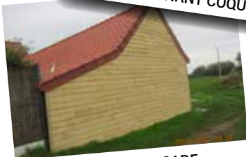
RAVALER LA FAÇADE DE VOTRE HABITATION