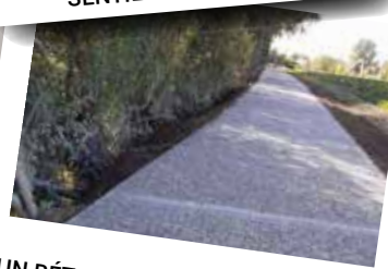
UN BÉTON DRAINANT COQUILLIER