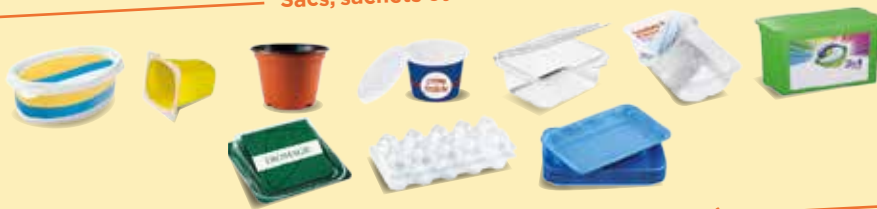
Pots, boîtes et barquettes en plastique ou polystyrène