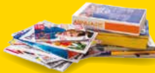
Journaux-magazines, prospectus, papiers, enveloppes et catalogues