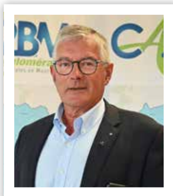
Bruno Cousein , Président de la Communauté d'Agglomération des 2 Baies en Montreuillois