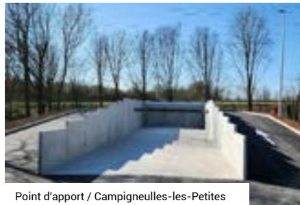
Point d'apport / Campigneulles-les-Petites

➔ Pour tout renseignement complémentaire : 0 800 880 695 (appel gratuit)