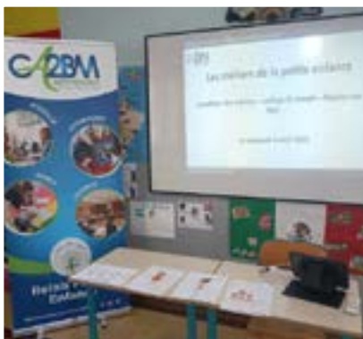
Intervention au collège St Joseph / Étaples/Mer