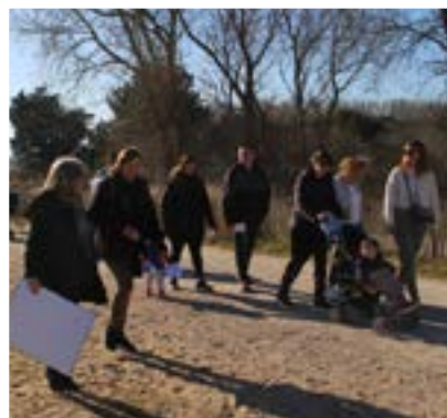
Semaine nationale de la Petite Enfance