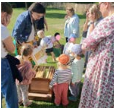
Sous le signe de la Nature et des abeilles / Montcavrel