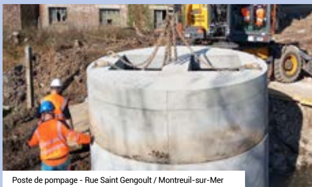
Poste de pompage - Rue Saint Gengoult / Montreuil-sur-Mer

Pour 2025/2026, la CA2BM a pour objectif la rénovation de 175 ouvrages d'hydraulique douce.