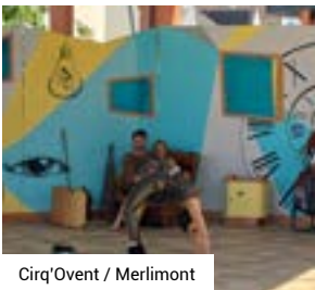
Cirq'Ovent / Merlimont

En partenariat avec l'association Archipop et la Cie Du Tire-Laine, la CA2BM proposait des soirées cinéma en plein air. Au programme, la projection d'images d'archives locales, un moment de partage et de convivialité sous les étoiles.