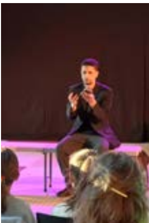
Vertige et Robotisé / Wailly-Beaucamp