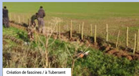
Création de fascines / à Tubersent