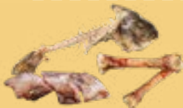
Viandes, os, arêtes de poisson