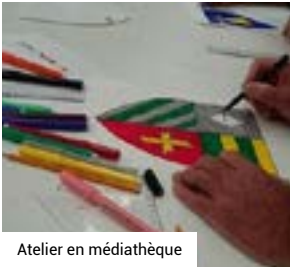
Atelier en médiathèque