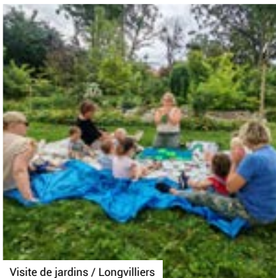
Visite de jardins / Longvilliers