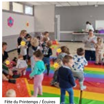
Fête du Printemps / Écuire