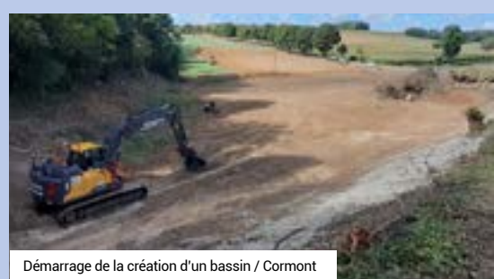
Démarrage de la création d'un bassin / Cormont

La surveillance du phénomène sédimentaire se poursuit et des rechargements pluriannuels en sable seront effectués, après autorisation des services de l'Etat.