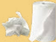
Essuie-tout, serviettes et mouchoirs en papier