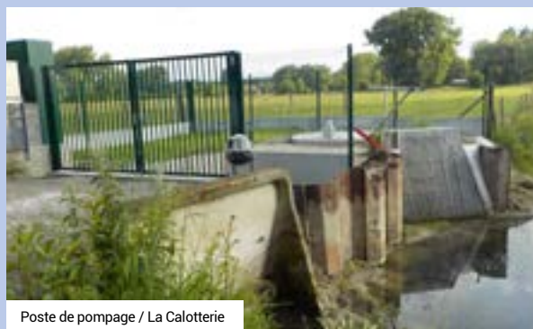
Poste de pompage / La Calotterie

En dehors des travaux structurants, la CA2BM envisage à court terme :