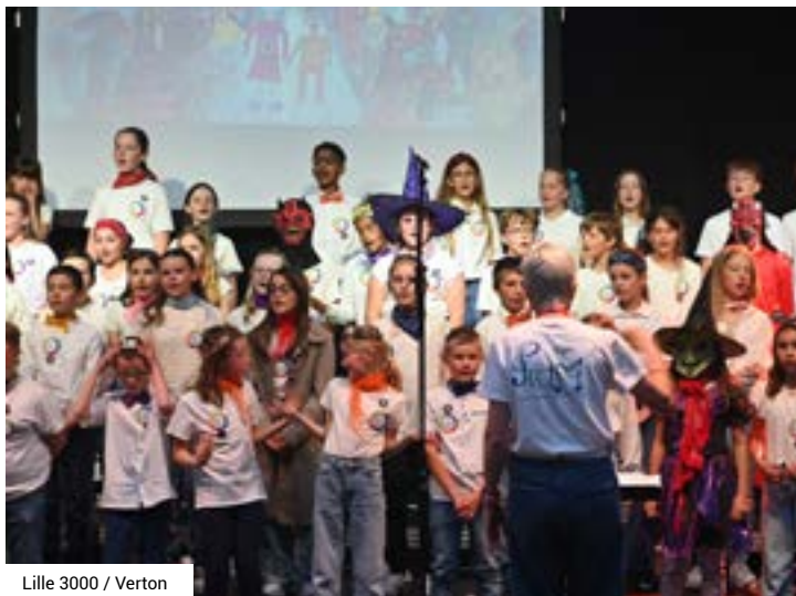
Lille 3000 / Verton

« Ecoles en musique », une opération s'inscrivant dans la dynamique portée par la CA2BM pour permettre de rendre la culture accessible à tous et adaptée aux besoins des usagers en l'occurrence, les scolaires.