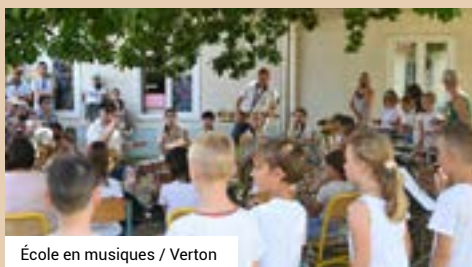
École en musiques / Verton

Ce projet pilote a pour ambition d'accompagner et de former un groupe de 60 élèves sur un cycle de trois années scolaires (CE2-CM1-CM2) et permettra de disposer de données quantitatives et qualitatives sur le lien bénéfique entre l'apprentissage musical et les apprentissages scolaires.