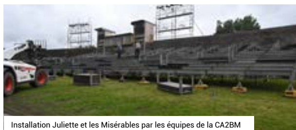
Installation Juliette et les Misérables par les équipes de la CA2BM