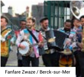
Fanfare Zwaze / Berck-sur-Mer