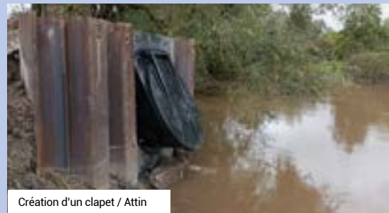
Création d'un clapet / Attin