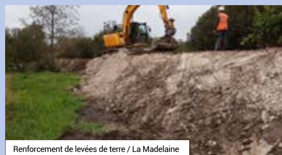
Renforcement de levées de terre / La Madelaine