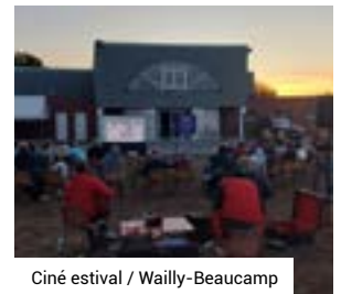
Ciné estival / Wailly-Beaucamp