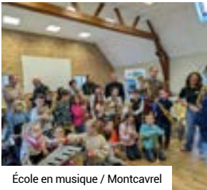
École en musique / Montcavrel