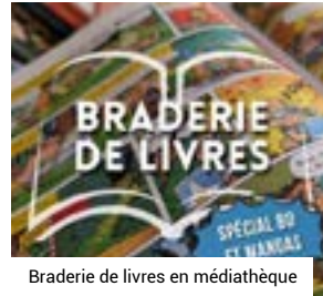
Braderie de livres en médiathèque