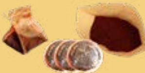
Sachets de thé, marc de café et dosettes de café en papier