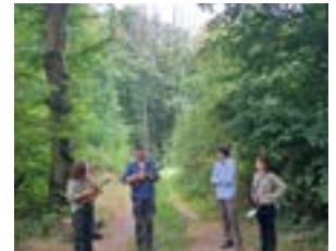
Les imaginaires / Saint-Josse-sur-Mer