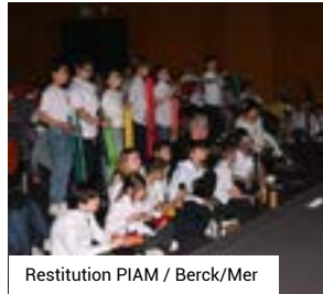
Restitution PIAM / Berck/Mer