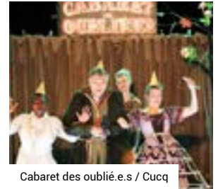
Cabaret des oublié.e.s / Cucq