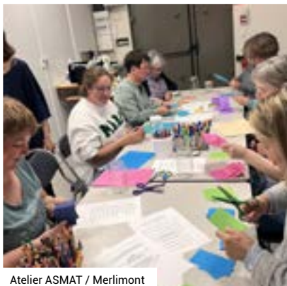
Atelier ASMAT / Merlimont