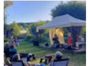
Espuma Antigua / La Madelaine-sous-Montreuil