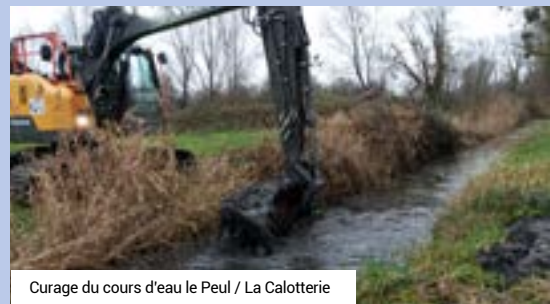
Curage du cours d'eau le Peul / La Calotterie