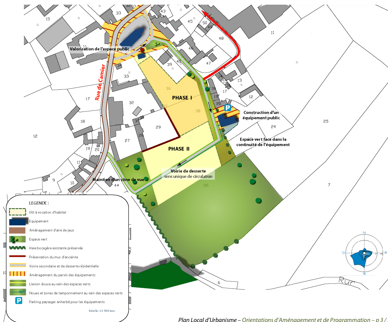
Schéma d'aménagement :