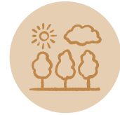
ENVIRONNEMENT ET CADRE DE VIE