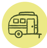
ACCUEIL DES GENS DU VOYAGE