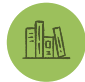
CULTURE ET RÉSEAU DE LECTURE PUBLIQUE