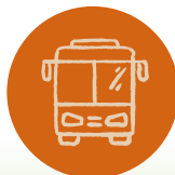
TRANSPORT ET MOBILITÉ