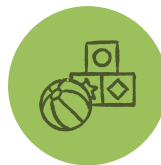
RELAIS PETITE ENFANCE