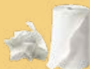
Essuie-tout, serviettes et mouchoirs en papier