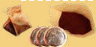
Sachets de thé, marc de café et dosettes de café en papier