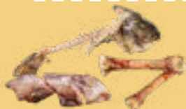
Viandes, os, arêtes de poisson