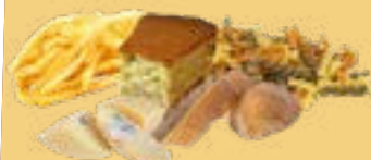
Restes de repas