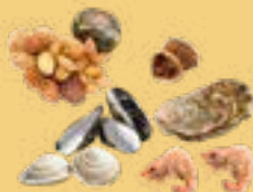
Coquillages, crustacés et noyaux